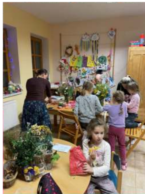
Dílničky v rámci akce "Růžový listopad"