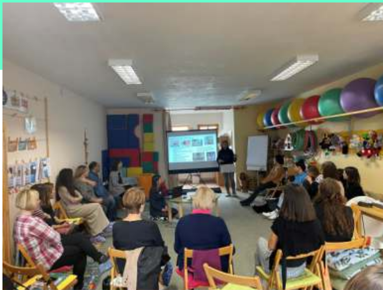
Prezentace projektu Babičko, dědečku vyprávěj na semináři grantistů Nadace Via